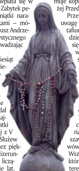
figurka Matki Bożej Niepokalanej w warszawskim getcie