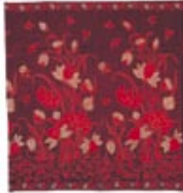
Kolorowe zdobienia wymagały od twórców czasu i wielkiej cierpliwości

Egzotyczna metoda zdobienia polega na wykonywaniu wzorów na cienkiej, najczęściej bawełnianej tkaninie. Rysuje się je na materiale przy pomocy roztopionego wosku, a następnie barwi na od-