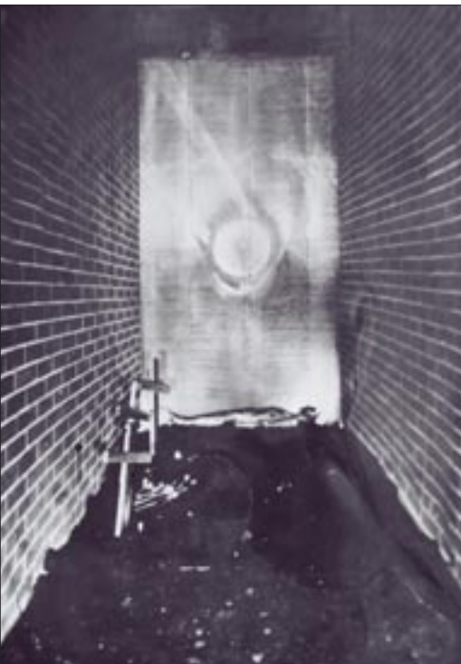
Groby Pańskie u św. Anny w roku 1944 (u góry) i 1950 (na dole)