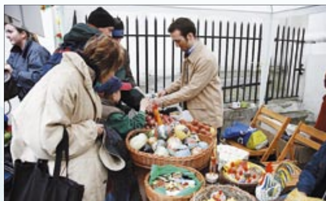
Przedświąteczna zbiórka jaj dla ubogich