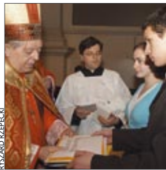
Kandydaci do bierzmowania składają na ręce Prymasa prośby o dopuszczenie do sakramentu

„Pokolenie JP II musi zrealizować się w działaniu” – mówił prymas Polski kard. Józef Glemp w Niedzielę Palmową podczas spotkania z młodzieżą w kościele Wszystkich Świętych w Warszawie.