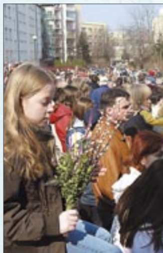
Palmy trzymane w rękach wiernych i dzieci są znakiem wiary w siłę Dobrej Nowiny – mówił Prymas na Stokłosach

Wniebowstąpienia Pańskiego na Stokłosach. Tradycyjnie już brały w nim udział szkoły, rodziny i osoby indywidualne, nie tylko z ursynowskich parafii. Palmy oceniała komisja, której przewodniczył prymas Polski kard. Józef Glemp. W Niedzielę Palmową parafia Wniebowstąpienia Pańskiego obchodziła 25-lecie pierwszej Mszy św. odprawionej wtedy jeszcze w tymczasowej kaplicy. „Nasze zmartwychwstanie zaczyna się tutaj, na ziemi, poprzez odrodzenia ducha, przez nawrócenie, przez odrzucenie zła” – podkreślił w homilii kard. Józef Glemp. Nawiązując do niedzieli Palmowej, prymas zaznaczył, że uroczystość ta ma być hołdem dla Jezusa, który „idzie cierpieć i zmartwychwstać po to, byśmy uwierzyli we własne zmartwychwstanie”. Prymas poświęcił też w kościele na Stokłosach nowe organy.