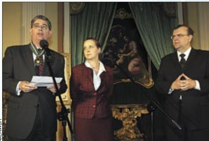
Minister Kazimierz Ujazdowski (z prawej) odznaczył medalem „Gloria Artis” G. Weigla

GEORGE WEIGEL W WARSZAWIE. George Weigel, teolog, publicysta, wybitny biograf Jana Pawła II, 20 kwietnia odebrał z rąk ministra Kazimierza Ujazdowskiego złoty medal za usługi „Gloria Artis”, najwyższe polskie odznaczenie w dziedzinie kultury. Dziękując za odznaczenie, George Weigel podkreślił, że napisanie biografii Jana Pawła II i zapoznanie się z polską kulturą było wielkim przywilejem jego życia. Biograf wygłosił w warszawskiej Bibliotece Uniwersyteckiej wykład „Polskie doświadczenie historyczne jako element kształtujący pontyfikat Jana Pawła II”. Zderzenie z totalitaryzmem, tradycja tolerancji religijnej i odważnej wiary, polska maryjność to czynniki, które, jego zdaniem, kształtowały pontyfikat Papieża Polaka. Weigel podkreślił, że to dzieki wierze i nadziei polski Papież