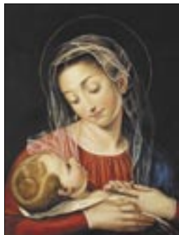
Kopia obrazu Matki Bożej Opatrzności Bożej, który jest czczony w kościele San Carlo ai Catinari w Rzymie

W czasie uroczystości wierni będą się modlić o szybką beatyfikację Jana Pawła II. Przy świątyni zostanie zasadzony pamiątkowy dąb Jana Pawła II, dla upamiętnienia jego