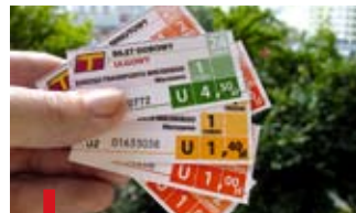
„Upragnione”, deficytowe bilety

KOMUNIKACJA. Warszawiacy mają powody do zdenerwowania. Od 2 czerwca Zarząd Transportu Miejskiego wprowadził nowe wzory i nominały biletów, które jednak trudno było kupić w kioskach. Dostarczono ich zbyt mało, a niektórzy kioskarze, w proteście przeciwko obniżeniu im marży za sprzedaż biletów, nie zamówili ich wcale. W większości kiosków nie do zdobycia były bilety czasowe, np. 20-minutowe, które są tańsze od biletów jednorazowych. W punktach ZTM kolejki starszych osób ustawiły się po bilet seniora, na który osoby po 65. roku życia mogą jeździć dowolnymi liniami przez cały rok. jjw