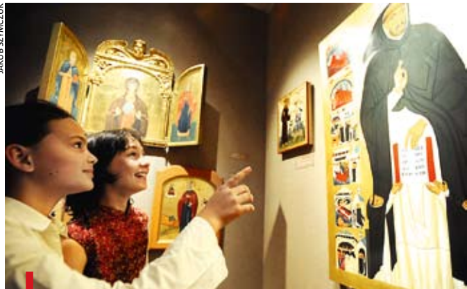
Wystawa towarzyszyła konferencji „Ikona dziś”