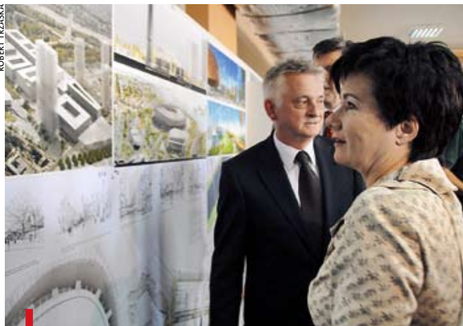
Prezydent Hannie Gronkiewicz-Waltz podobała się promenada, która może stać się miejscem spotkań warszawiaków

PRAGA. Miejski plac wielkości Rynku Starego Miasta, terminal łączący przystanek kolei, metra i tramwajów, biurowiec w miejscu dzisiejszego dworca PKS, hala widowiskowo-sportowa, centrum kongresowe, a wszystko połączone pieszą promenadą – takie okolice