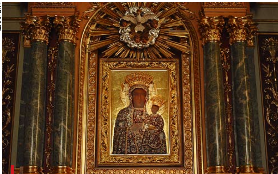
PLAC ZBAWICIELA. Obraz ukoronował Jan Paweł II 13 czerwca 1999 r. na pl. Piłsudskiego