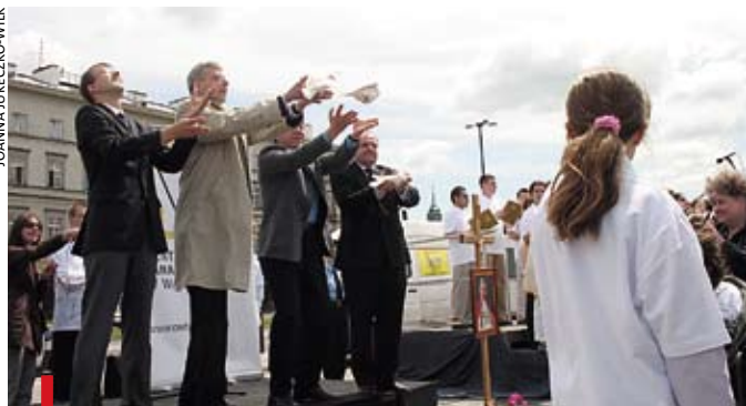
Inauguracja programu stypendialnego odbyła się 9 czerwca 2006 roku

gimnazjów, szkół ponadgimnazjalnych oraz studentów uczących się w Warszawie, którzy mimo trudnych warunków materialnych, rodzinnych lub zdrowotnych osiągają wysokie wyniki i twórczo angażują się w różnorodne inicjatywy. Termin składania wniosków mija 31 lipca (uczniowie) lub 30 września (studenci). Komisja przyzna ok. 600 stypendiów w kwocie od 200 do 1500 zł każde.