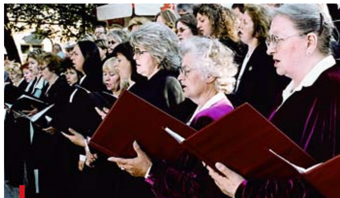
W 2005 roku chór zdobył I miejsce na przeglądzie chórow kościelnych „Caecilianum”. NA ZDJĘCIU: podczas uroczystości ku czci św. Andrzeja Boboli, 2002 r.

i różnych zawodów: uczniów, studentów, inżynierów, rzemieślników, nauczycieli, psychologów, prawników, lekarzy itp. Przeważającą część bogatego repertuaru w dorobku zespołu stanowi muzyka liturgiczna. Chór nagrał dziewięć płyt z muzyką polską i cerkiewną muzyką religijną. Za nagranie polskich koled został nagrodzony w 2000 roku podwójną platynową płytą.