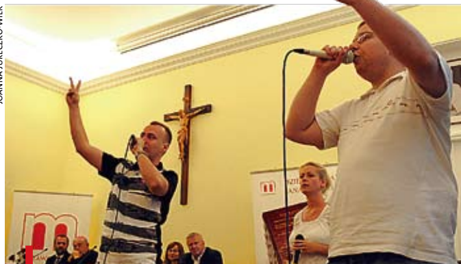
Zespół Full Power Spirit na promocji tomu papieskich katechez

PAŁAC PRYMASOWSKI. „Zostań Bożym wojownikiem” śpiewał w rytmie hip-hop zespół Full Power Spirit, podczas promocji VIII tomu „Dzieła Zebranych Jana Pawła II”. Na promocję, która odbyła się 11 czerwca w siedzibie arcybiskupa warszawskiego, przyszła młodzież z warszawskich liceów: Sióstr Nazaretanek oraz im. Piotra Skargi. Metropolita abp Kazimierz Nycz zachęcał młodych do czytania dzieł Papieża, by „swoje życie budować na