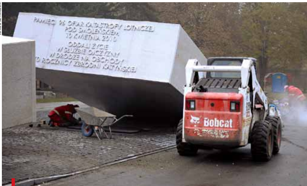
POWĄZKI, 28 PAŹDZIERNIKA. Ostatnie prace przy głównej części pomnika smoleńskiej katastrofy

G otowy jest już pomnik ofiar katastrofy smoleńskiej na wojkowych Powązkach. Stoi u wylotu Alei Profesorskiej. Z ziemi wyłaniają się dwie części granitowego, białego bloku, jakby przełamane na pół. Część głównej białej bryły jest umieszczona nad mogiłą, w której pochowano spopielone szczątki 12 ofiar katastrofy lotniczej. Na ścianach bryły umieszczono listę nazwisk i napis: „Pamięci 96 ofiar katastrofy lotniczej pod Smoleńskiem 10.04.2010”.