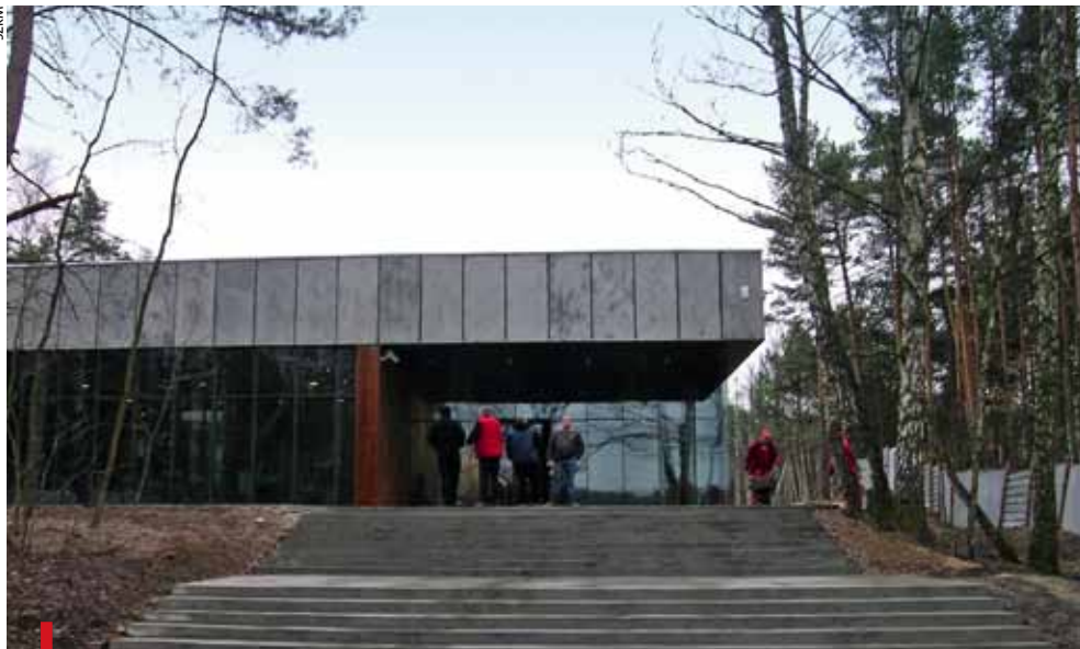
PALMIRY, 18 MARCA. Jeszcze ostatnie poprawki i będzie można witać zwiedzających