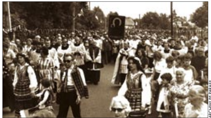
Nawiedzenie obrazu MB Częstochowskiej w 1981 roku