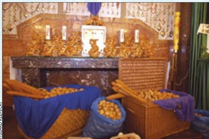
Po Mszy św. wypieki warszawskich piekarzy zniknęły w torbach wiernych

rze, których św. Klemens jest patronem. Mszę św. odprawił bp Tadeusz Pikus, który pobłogosławił kosze pełne chlebów i bułek. Po Eucharystii wszystkie wypieki zniknęły w okamgnieniu w torbach wiernych. Św. Klemens zanim został redemptorystą pracował w piekarni.