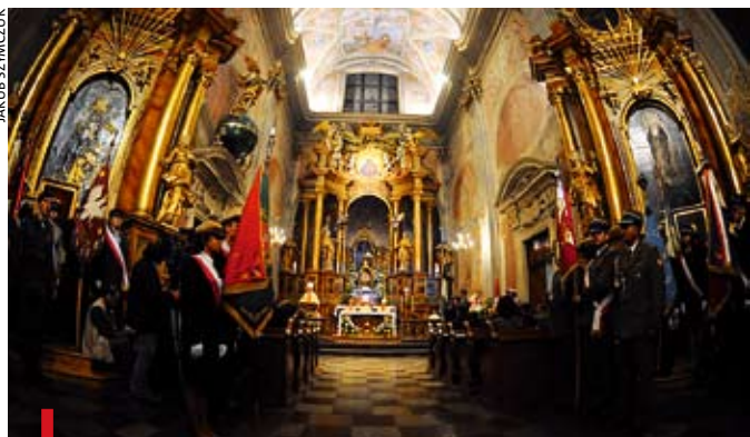
Eucharystia była elementem centralnych obchodów VIII Dnia Papieskiego w stolicy i jednocześnie inauguracją roku akademickiego warszawskich studentów