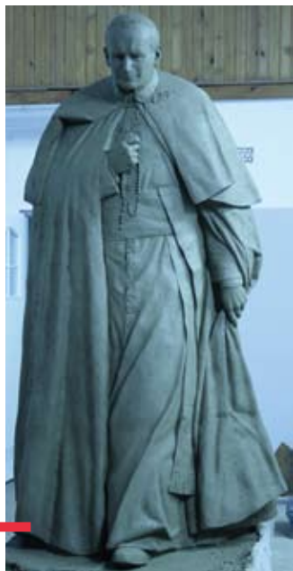
Kard. Wojtyła odwiedził Lewiczyń 10 sierpnia 1975 r.