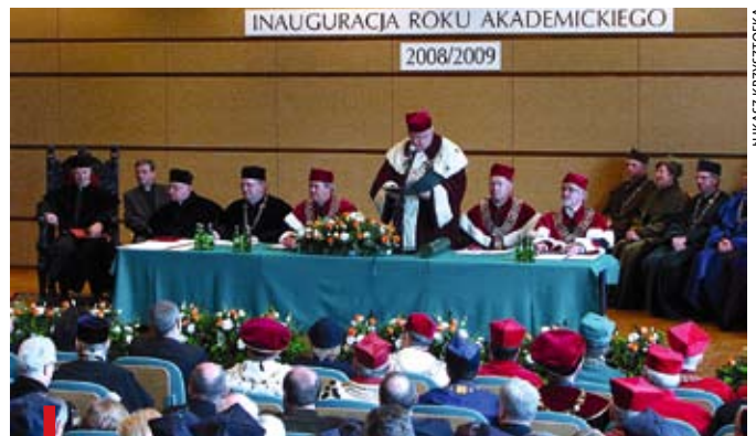
Studia na UKSW rozpoczęło w tym roku blisko 19 tys. studentów