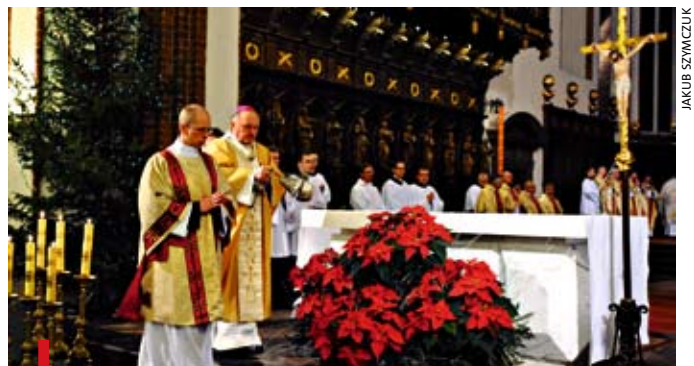
W przedostatnim dniu starego roku arcybiskup metropolita warszawski Kazimierz Nycz w bazylice archikatedralnej św. Jana Chrzciciela odprawił Mszę św. w 70. rocznicę śmierci kard. Aleksandra Kakowskiego