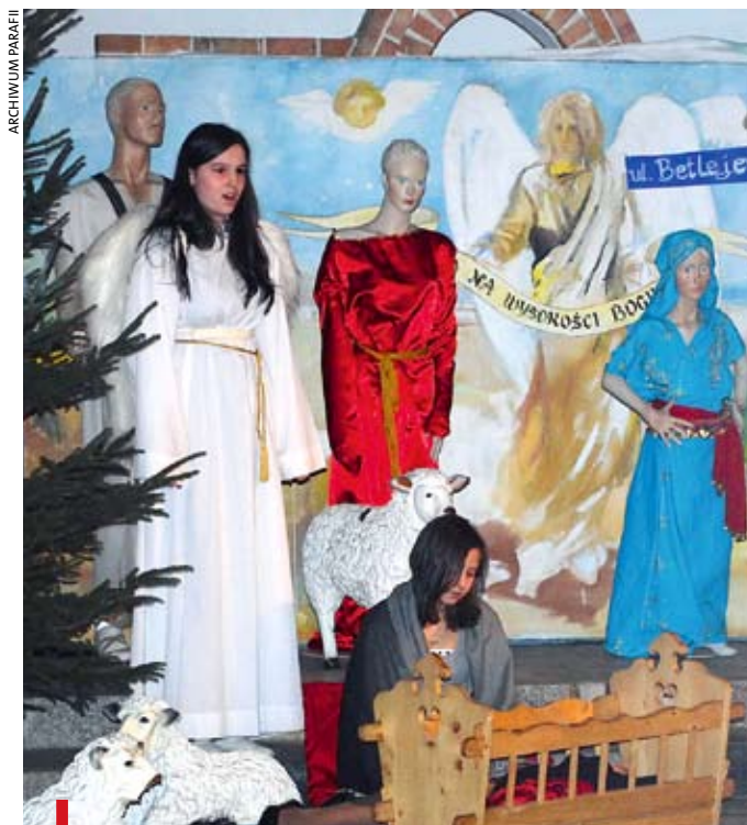
Młodzi józefowianie w uwspółcześionych jasełkach

A tak w dużym skrócie wygląda przedstawienie: Marysia