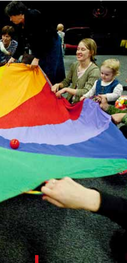
Warsztaty z wiązania chusty, spotkania z pediatrą i nauka angielskiego – mamy na Bielanach nudzić się nie mogą