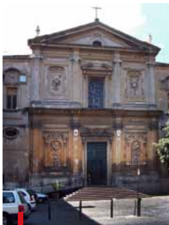
Bazylika św. Sylwestra i Marcina w Rzymie jest kościołem tytularnym kard. Kazimierza Nycza

Kard. Kazimierz Nycz został proboszczem bazyliki przy Via Domenichino 7, zbudowanej przez papieża Sylwestra w IV w.