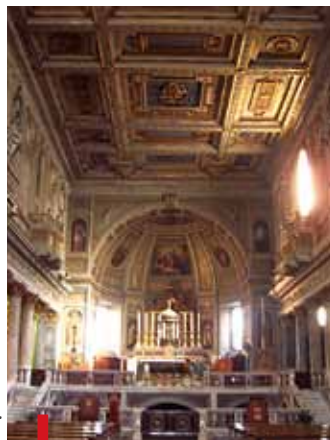
We wnętrzu bazyliki znajdują się relikwie między innymi św. Pauliny i Artemii

Każdy z kardynałów ma w Rzymie swoją diakonię lub kościół tytularny, co symbolizuje jego związek z Wiecznym Miastem i przynależność do kleru rzymskiego. W ten sposób kardynał staje się rzymskim proboszczem, członkiem Świętego Kościoła Rzymskiego. Kardynałowie-biskupi związani są z jedną z podmiejskich diecezji, przy czym dziekan Kolegium Kardynalskiego posiada tytuł biskupa Ostii. Obowiązkiem każdego nowo mianowanego kardynała jest objęcie swojego kościoła tytularnego.